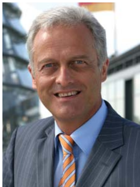
Bundesverkehrsminister Peter Ramsauer

Ramsauer: "Die vielen Freiwilligen bei der Feuerwehr und bei Katastrophen- und Hilfsdiensten leisten eine unschätzbare Arbeit zur Rettung von Gut und Leben. Gerade in den ländlichen Räumen muss der Nachwuchs gefördert werden. Daher will ich dieses Engagement für unsere