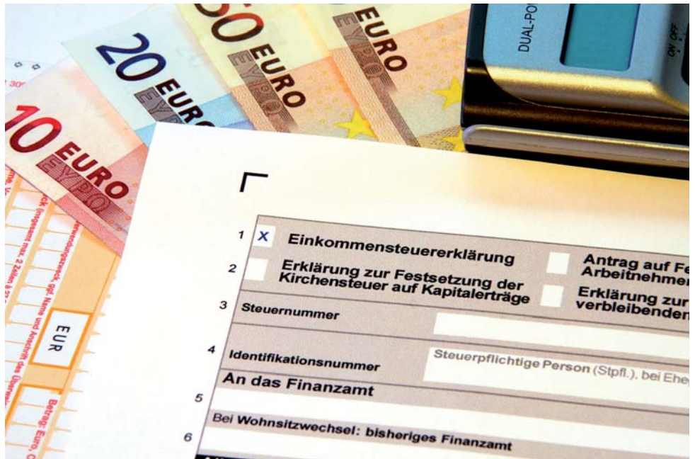
Der „Ort der sonstigen Leistungen“ wurde neu geregelt.

Wie der leistende Unternehmer den Nachweis zu führen hat, dass der Leistungsempfänger die Leistung für sein Unternehmen bezogen hat – was bei einem ausländischen Unternehmer zur Verlagerung des Leistungsorts ins Ausland führen kann – dazu macht das Gesetz selbst keine Angaben. Verwendet der Leistungsempfänger jedoch seine Umsatzsteueridentifikationsnummer (USt-ID), dann kann der Dienstleistende regelmäßig davon ausgehen, dass sein Kunde die Leistung für sein Unternehmen und nicht für den privaten Bereich bezogen hat . Der leistende Unternehmer hat jedoch die USt-ID beim Bundeszentralamt für Steuern ( http://evatr.bff-online.de/eVatR/ ) prüfen zu lassen. Hat der Kunde seinen Sitz im Drittland und damit außerhalb der Europäischen Union , kann die Unternehmereigenschaft durch eine Bescheinigung im Sitzstaat des Leistungsempfängers erfolgen.